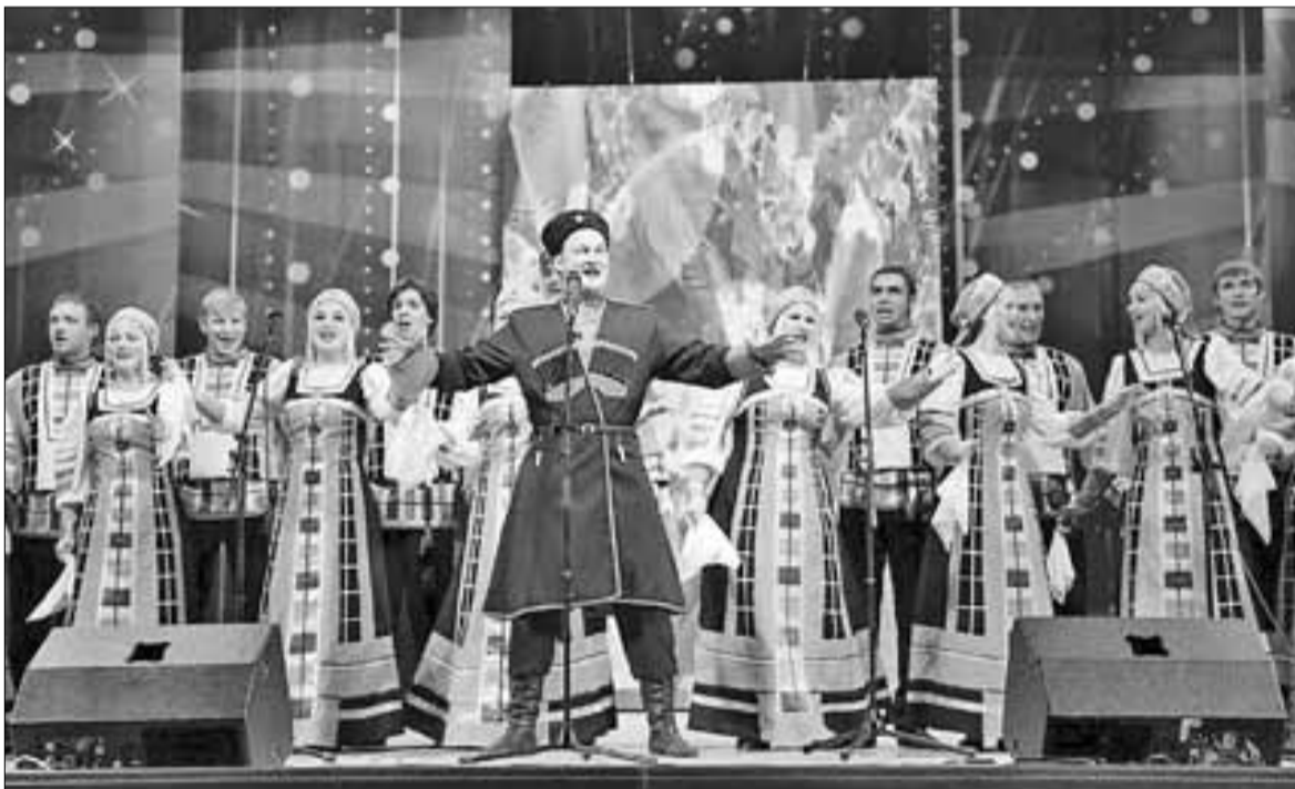
■ Коллектив из Воронежа «Весенние зори»

– Мы совсем недавно узнали о существовании фестиваля творческой молодежи городов воинской славы и городов-героев «Помним. Гордимся. Верим». В этом году нам пришло приглашение и мы очень обрадовались. Это почетно – принять участие во всерос-