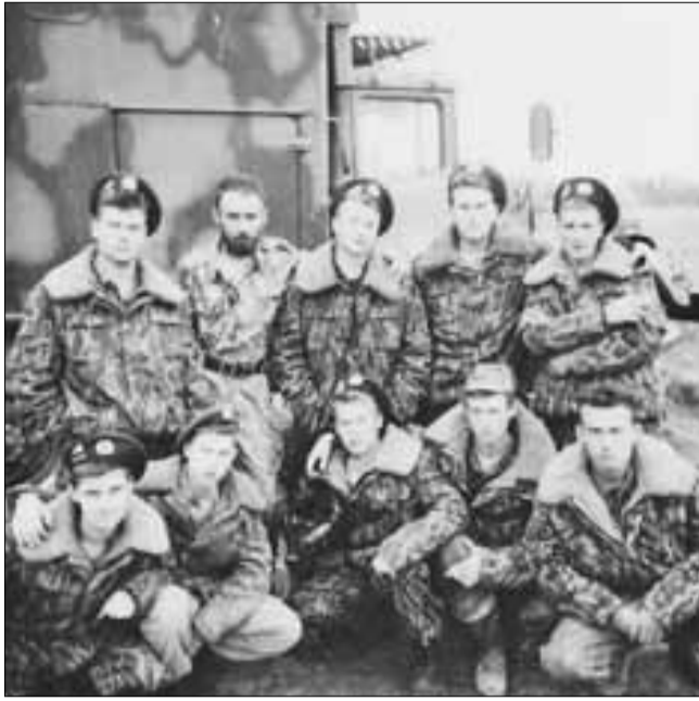
■ Чечня. Октябрь 1995 года.

На станции Терек стояли сутки. Видели зарево и слышали непрекращающиеся канонады, массивные обстрелы километрах в ста от нас. На следующий день водители занимались снятием техники, готовили автомобили к маршу к месту дислокации, а роты укомплектовывались боезапасом, полу-