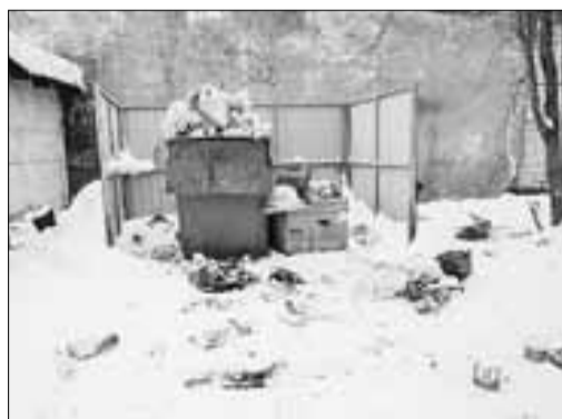
■ Ул. Карельская, 49, ООО «УК Партнер»