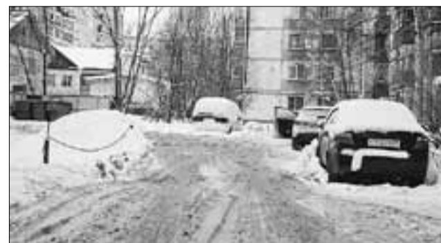
■ Ул. Комсомольская, 45, ООО «Городское жилищное управление».