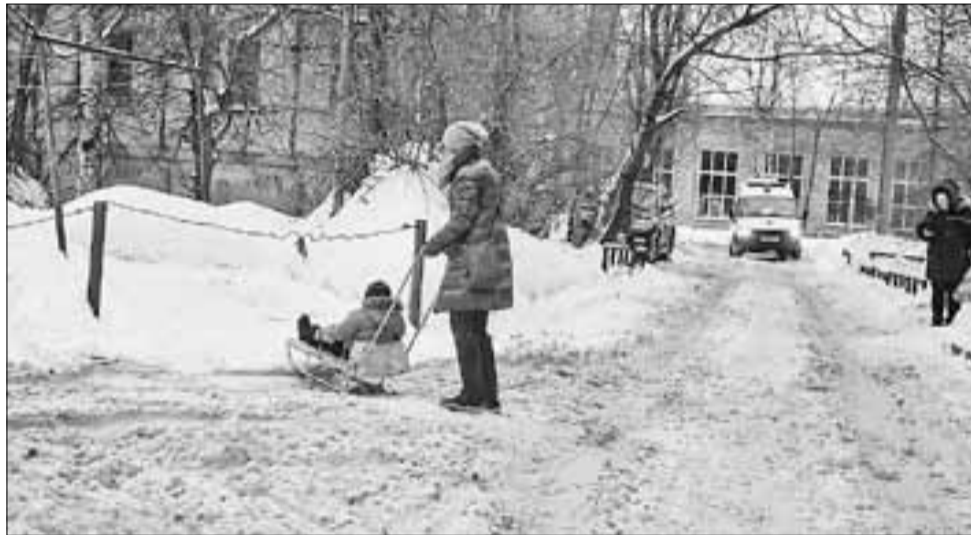
■ Ул. Вологодская, 42, корп. 1, ООО «Торн-1».

Заместитель мэра по городскому хозяйству Святослав Чиненов отметил, что замечаний по работе подрядных организаций как в центре города, так и на окраинах остается много.